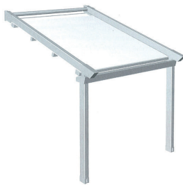
Dimensions modèle 1 travée : Mini : 1500 x 1500 Maxi 4500 x 5000