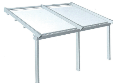
Dimensions modèle 2 travées : Mini : 4500 x 2000 Maxi : 8000 x 5000