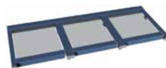
Alizé 3 travées • 2 moteurs Largeur de 9 m à 12 m Avancée de 1,50 m à 4,25 m