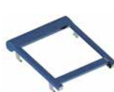
Alizé 1 travée • 1 moteur Largeur de 2 m à 5 m Avancée de 1,50 m à 4,25 m