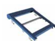
Alizé maxi 1 travée • 1 moteur Largeur de 2,5 m à 6 m Avancée jusqu'à 5 m