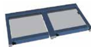
Alizé 2 travées • 1 moteur Largeur de 5 m à 9 m Avancée de 1,50 m à 4,25 m