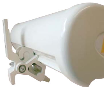
Console de pose en fonte d'aluminium