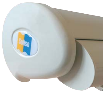
Joues de coffre moulées en aluminium