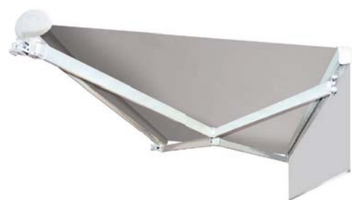
Toile teintée dans la masse 100% acrylique, proposée dans un très grand choix de coloris.